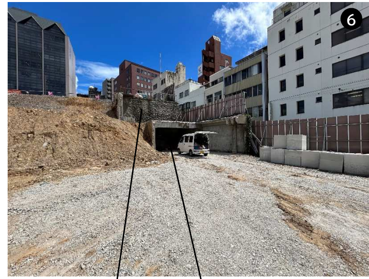
石積存置 コンクリート構造体存置