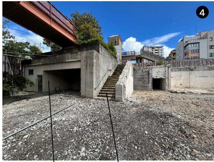
倉庫存置 階段存置