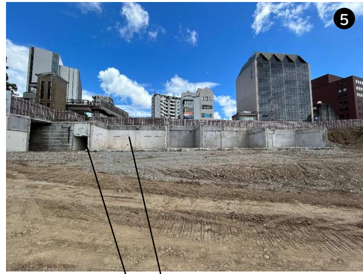
地下通路存置 コンクリート構造体存置(土留め)