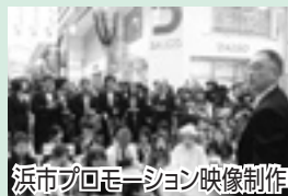
浜市プロモーション映像制作