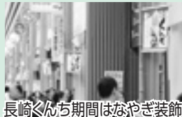
長崎くんち期間はなやぎ装飾