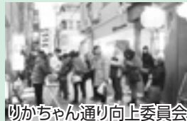
りかちゃん通り向上委員会