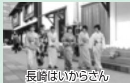
長崎はいからさん