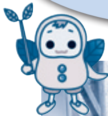
マスコットキャラクター まめんちよ

7月20日～8月31日の金・土・日開催。タクシーで移動します。JR長崎駅か市内ホテル発着だよ。