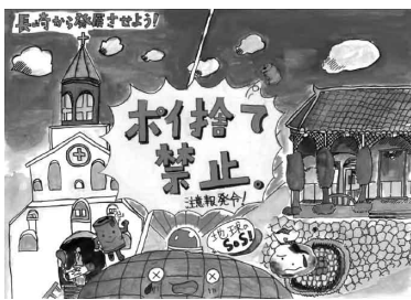
昨年の最優秀作品

対市内の小・中学生 テ【小学生の部】：ごみのポイ捨ておよび歩きたばこをやめて、美しい長崎(中学生の部)：地球の環境をみんなで守ろう、地球にやさしい人のまち長崎 ※いずれも、サイズは四つ切りで、各自で考えた啓発標語・メッセージなどをに入れてください。申作品の裏に住所、氏名(ふりがな)、性別、学校名・学年を書いて、長崎市廃棄物対策課(〒850-08685 桜町2-22)へ郵送か、持参。申(期限)9月5日(木)必着 他応募者全員に参加あり。