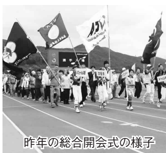
昨年の総合開会式の様子

期 9月29日(日)～11月3日(日) ※競技により開催日が異なります。総合開会式は10月14日(祝) 所 市総合運動公園ほか 申 スポーツ振興課(市民会館2階)、行政センター、支所などにある実施要項にそつてお申し込みください。 申 (期間)7月22日(月)～8月19日(月)必着 ※競技により申し込み期間が異なります。