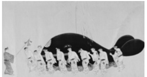
甲斐宗平「鯨の汐吹絵巻」(一部)

日 9月17日(火)午後7時～ 所 長崎ブリックホール ラウンジ 内 (出演) For Your Note(ポップス)、マザーリーフ(ポップス)、アルビオン・クラリネット・ヴァリエ(クラリネットアンサンブル)、Ever green(ギター・アルパ)、安川徹(ピアノ)、Voce(アカペラ) 問 文化振興課(☎842-3782)