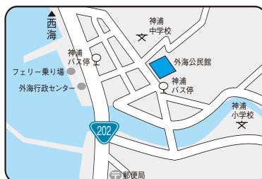
長崎市外海公民館 ☎0959(24)0460 FAX0959(24)0460 〒851-2403 長崎市神浦江川町2番地