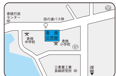
長崎市香焼公民館 ☎(871)5213 FAX(871)5213 〒851-0310 長崎市香焼町501番地2