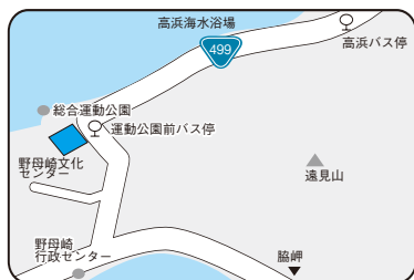
長崎市野母崎文化センター ☎(893)2022 FAX(893)2025 〒851-0505 長崎市野母崎555番地