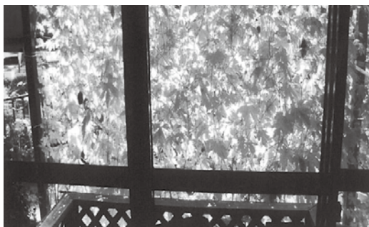
昨年度最優秀賞（市民部門）

（日）、「ながさきエコライフ・フェスタ」で表彰 問環境政策課（☎829-1156）