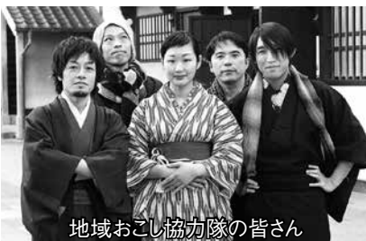
地域おこし協力隊の皆さん

長崎市外の都市部から、地域の活性化のために、地域の人たちと一緒に活動を行う「地域おこし協力隊」が、これまでの活動を報告します。目8月27日(水)午後6時～ 所メルカつきまち5階