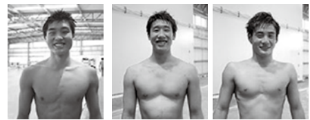
全九州高等学校体育大会水球競技 ベスト4 長崎工業高等学校3年