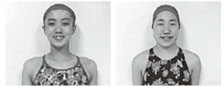
関西選手権デュエット8位 長崎日本大学高等学校2年