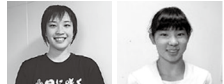
全国ジュニアオリンピック夏季大会 400m個人メドレー予選9位 長崎商業高等学校3年 400m個人メドレー