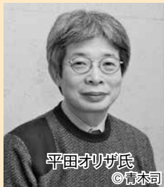
平田オリザ氏

日・所 高校生…11月20日(木)午後6時～9時 長崎ブリックホールリハーサル室／一般…11月24日(休)午後8時～9時30分 メルカつきまち 定 各30人 申 文化振興課(茂里町)にある応募用紙を提出。