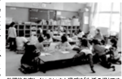
放課後を楽しくいきいきと過ごす「生活の場」です

クラブによつて過ごし方はさまざまですが、指導員のもとで、みんなで遊んだり、読書や勉強をしたりして過ごします。また、土曜日や夏休みなど、学校が休みの日には、保護者も協力して外に出かけているクラブもあります。例えば、地域の行事に参加したり、資料館などの施設の見学に行ったり…。どのクラブも、保護者、地域のほか、指導員が協力して、子どもたちのためによりよい環境づくりを努めています。