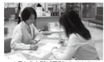
1月から支所が便利になります！

◆子育てなどに関する受付 特別児童扶養手当の資格認定などに関する申請、保育所の入所などに関する申請 そのほかにも、奨学金の願書受付や公共施設案内予約システムの利用者登録、原動機付自転車、自乗車の登録・廃車、土地・家屋台帳の交付などの手続きもできます。