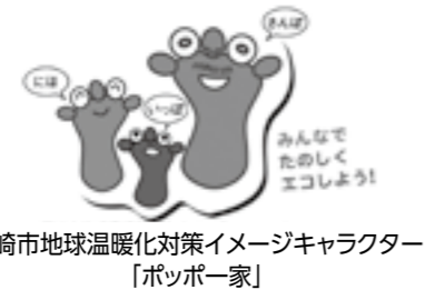
長崎市地球温暖化対策イメージキャラクター「ポッピー一家」

「誰でも」「いつでも」「簡単に」できる主な取り組みは、 ・ 誰もいない部屋の照明を消す ・ 冷蔵庫は詰め込みすぎず、扉を開ける時間は短く