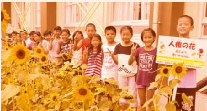
「人権の花」運動のようす

「人権の花」運動とは、おもに小学校に花の種子・球根等を配布して、小学生の皆さんがお互いに協力しながら花を育てることによって、生命の尊さを実感し、また、その中で豊かな心を育み、優しさと思いやりの心を体得することを目的とした、人権擁護委員等で構成される長崎地域人権啓発活動ネットワーク協議会による啓発活動で、昭和57年度から実施しています。