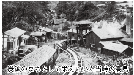
炭鉱のまちとして栄えていた当時の高島

世界文化遺産候補の旧炭鉱のまち 歩きを楽しみませんか。緑色の桜 (御衣黄桜)や軍艦島が見られます よ。 日 4月5日(日) 午前10時〜午 後5時 ※荒天時は中止 所(集合) 高島港ターミナル ※大波止ターミナ ル 午前8時50分発 / 伊王島ターミナ ル 午前9時12分発 内 高島の史跡巡 り(約3時間) ↓ 昼食(高島ヒラメ定 食) ↓ いやしの湯温浴施設体験(水着 と水泳帽子、タオルをご持参くださ い) 定 50人 費 1900円(交通費 別途) 申 はがきに参加者の住所・氏名、年齢、性別、電話番 号を書いて、高島いやしの湯(T85111315 高島町 2706-19)へ。ファクス(☎896・2350)でも可。 申(期 限)3月25日(水) 他 当選者に電話連絡をします。 問 高島い やしの湯(☎896・2345)