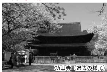
功山寺(過去の様子)

◆関門海峡 桜の競演と桜名所・城下町長府散策 関門海峡の兩岸の桜を望み、「人道トンネル」を歩いて本州にわたった後は、唐戸市場や桜名所の国宝「功山寺」などを訪れます。期3月27日(金)・28日(土)、4月3日(金) 午前7時30分~午後7時 費大人4300円、小学生3000円 ※4月3日出発分は各500円増し。