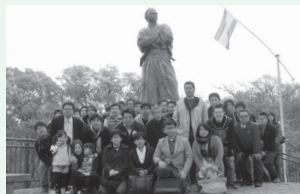
レクリエーションが多く、明るい職場です

自分の考えや意見をしっかり持つようにしましょう!先輩や上司に対して「自分はこうしたい」という考えがないまま