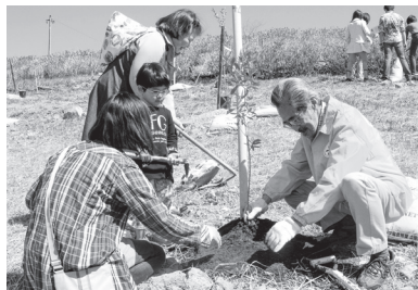
一つ一つ大切に植樹しています

長崎や仲間を大切にしている長崎オリーブ研究会の思いが多くの人に届き、オリーブ畑が増えていくことを楽しみにしています♪これからも活動を頑張ってください!