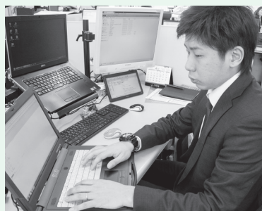
これまでに培った技術で新しい仕事にもチャレンジ!