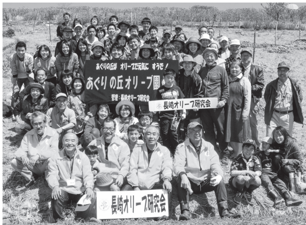
3月28日、あぐりの丘で行われた植樹祭。メンバーとともに、大学生や家族連れなど約90人のかたが苗木を植樹しました!

子育ても仕事も一段落し、地域のために何かしたい!そんな人たちが集まる団体。メンバーはみんなお話し好きで、気が置けない仲間が集まります。