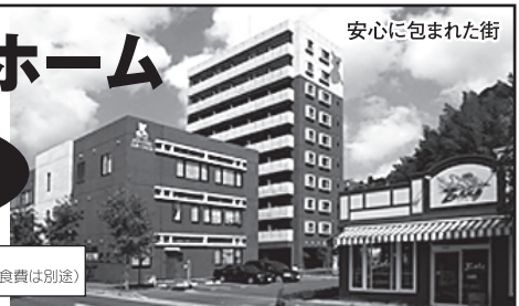
安心に包まれた街