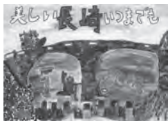
昨年度 小学生の部 最優秀作品

廃棄物対策課 ☎829-1159 対市内の小学生 テ「小学生の部」ごみのポイ捨ておよび歩きたばこをやめて、美しい長崎「中学生の部」地球の環境をみんなで守ろう、地球にやさしい人のまち長崎※いずれもサイズは四つ切り。各自で考えた啓発標語・メッセージなどを入れてください。申作品の裏に住所、氏名(ふりがな)、性別、学校名・学年を書いて、長崎市廃棄物対策課(〒850-0868 桜町2-22)へ郵送か持参。申(期限)9月10日(木)必着 他応募者全員に参加賞あり。