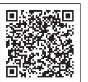
臨時福祉給付金QRコード