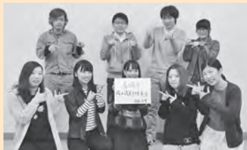
成人式を盛り上げようと、成人式実行委員(新成人)の皆さんが活動しています!!

対平成7年4月2日生~平成8年4月1日生のかた 日1月10日(日)午後2時~2時30分(午後1時開場) ※午後1時50分以降は入場不可 他11月1日付で長崎市に住民票があるかたへ案内状を送付していますが、当日は持参不要です。また、現在市外にお住まいのかたも参加できます。※当日はブリックホール近隣の道路が混み合います。公共交通機関をご利用ください。