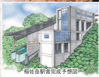
稲佐岳駅舎完成予想図

4月23日(土)に長崎ロープウェイ稲佐岳駅舎のエレベーターが供用開始。利便性が上がります。特典(料金が半額など)いっぱい「稲佐山空遊倶楽部」の会員も募集中です。問=長崎ロープウェイ ☎ 861-3640