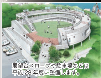
展望台スロープや駐車場などは平成28年度に整備します。