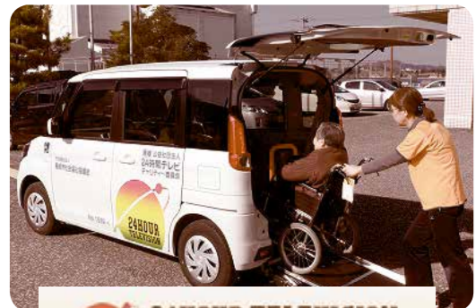
24HOUR TELEVISION 24時間テレビ 愛は地球を救う "24HOUR TELEVISION / LOVE SAVES THE EARTH"

地域福祉及び在宅福祉の担い手として、地域に密着した様々な福祉サービスの提供が求められている市社協では、この福祉車両贈呈により、高齢者・障がい者など誰もが地域で暮らしていくためのサービスの拡充を図ることができます。