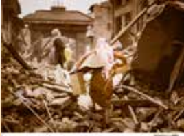
人がいる、試されている。

東日本大震災から「5年」。日本赤十字社では、発災直後から被災者の救護活動や救援物資の配布など、様々な活動を行ってきました。