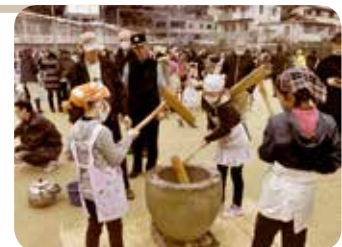
【支部でのもちつき大会の様子】