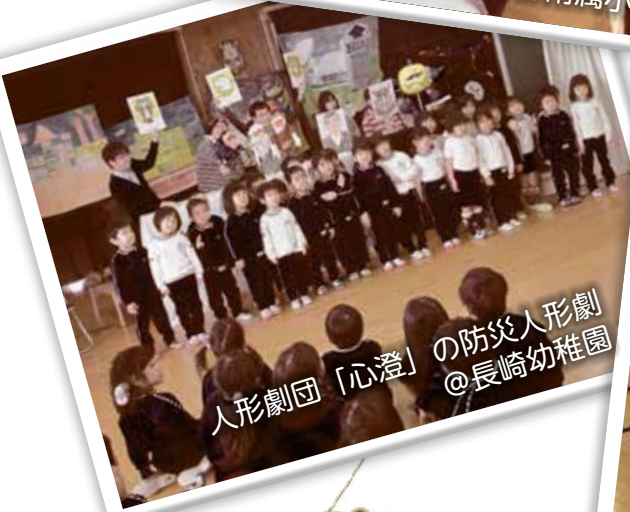
人形劇団「心澄」の防災人形劇 @長崎幼稚園