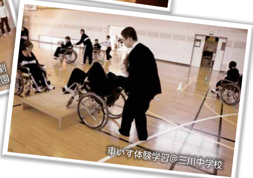
車いす体験学習@三川中学校