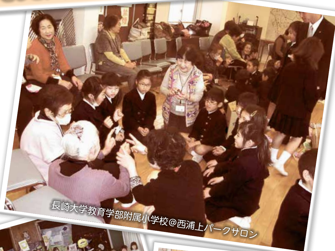
長崎大学教育学部附属小学校@西浦上パークサロン