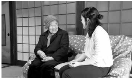
被爆体験を記録し、活動に生かします

話し方講座などさまざまな支援を行なっています!活動を動画で詳しく紹介していますので、スマホなどで右のQRコードを読み込んでご覧ください。詳しくは、 問 被爆継承課(☎844-3913)までお尋ねください。