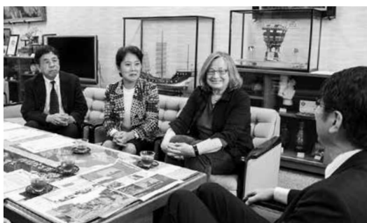
海や山がある長崎市の景観は素晴らしいと語るジュエル教授

長崎の魅力を再発見し、住みよいまちづくりを考える「長崎ランドスケープ国際ワークショップ」(長崎大学主催)に参加するため、米国カリフォルニア州立大学バークレー校のリンダ・ジュエル教授が学生らと来崎。