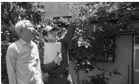
地域のかたと話をしながら、危険箇所をチェック

梅雨の時期を前に、災害危険予想箇所の点検と防災意識の啓発を行うため、5月23日に防災合同パトロールを実施。