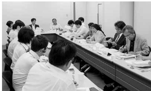
長崎学に関わる団体が参加して意見交換