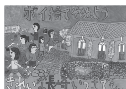
昨年度 小学生の部 最優秀作品

対 市内の小中学生 テ 【小学生の部】ごみのポイ捨て及び歩きたばこをやめて、美しい長崎【中学生の部】地球の環境をみんなで守ろう、地球にやさしい人のまち長崎 ※いずれもサイズは四つ切り画用紙で。各自で考えた啓発標語・メッセージなどを入れてください。 申 作品の裏に住所、氏名(ふりがな)