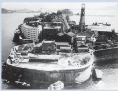
昔の端島(軍艦島)の様子

パネル展示や映像、実物資料で、軍艦島の魅力をより分かりやすく紹介する施設になりました。時 午前9時～午後5時 所 野母町562番地1 費 大人200円、小中学生100円 他(休館日) 年末年始