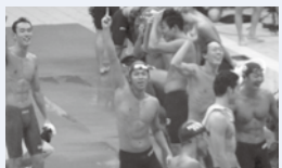
今後も水泳を続けて行きます!

現在も水泳を続け、コーチをしています。また、大学時代の友人に会いに、年に数回東京に行ってリフレッシュしています。