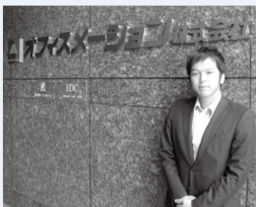
いずれは会社を引っ張っていく存在に!

主にIT関連の分野で、県内全域の法人などを対象に、商品の「システム開発」、「販売」、「メンテナンス」を行っています。お客様との「つながり」を大事にし、日々仕事をしています。