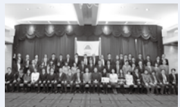
何事も社員一丸となって!

雰囲気の良い職場です。先輩と飲みに行くこともありますし、新年会や社内旅行など、充実した社会人生活を送っています。