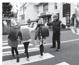
雨の日も風の日も活動します