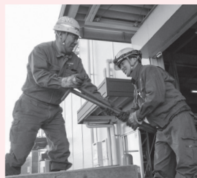
「芯が強くてまじめ。仲間からの信頼も厚い」と先輩たちは言います!

機械を扱うことが多いのもあって、大きな事故を起こすことがないように、みんな細心の注意を払いながら、それぞれの作業に集中しています。ただ、いったん仕事を離れると、先輩後輩関係なく、面白い人ばかりで和気あいあい! 毎日が充実しています。