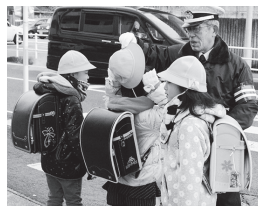
「帽子が曲がるとよ」と児童の身なりをチェックする場面も

残念なことに、昨年9月、下校中の児童が事故に遭ってしまいました。その後、ドライバーに注意を呼びかける看板を手作りするなど、安全への気持ちが一段と強くなりました。