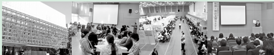
図書館の相互利用、高齢者ケアに係る研修会、合同企業面談会、婚活支援など

行政サービスを効率的・効果的に提供することで、さまざまな住民の要望に持続して対応したり、地域の課題を解決するなどして安心して暮らしやすい都市圏の形成を目指します。