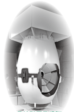
長崎型原子爆弾 （ファットマン）