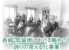
長崎・居留地における賑わいと誇りの見える化事業