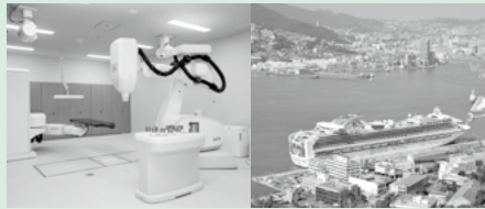
高度な医療サービスの提供や中心拠点などの整備

圏域の都市機能を活かし、ネットワークをさらに強化して、圏域全体の活性化と住民の暮らしの向上を図ります。