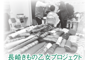
長崎きもの乙女プロジェクト