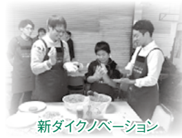
新ダイクノベーション