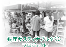
銅座サステイナブルタウンプロジェクト