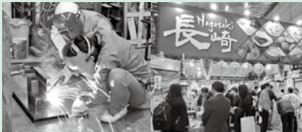
製造業や物産の振興

それぞれの地域が持つ資源を磨いて、人と人との交流を促しながら、経済の強化と雇用の創出を図ります。