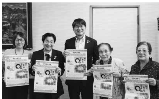
女性の絆で子どもを守ります

10月15日、県内の女性団体が連携し子どもと子育て家庭を見守る「子どもを守る長崎ひまわりプロジェクト」の代表者がプロジェクトの発足を報告しました。