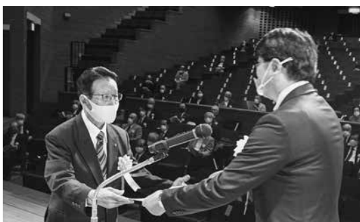
長年の自治会活動ありがとうございます

11月7日、永年にわたる自治会活動を通して、地域のまちづくりに貢献した方々に感謝状を贈呈しました。今年度は新型コロナウイルス感染症対策のため、感謝状贈呈式のみで開催でした。