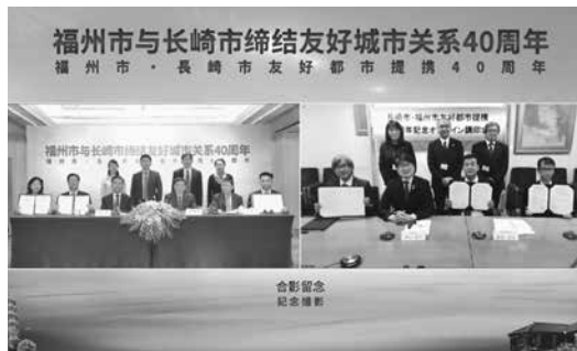
調印式はオンラインで行いました

昭和55年に中国・福州市と友好都市締結を行いちょうど40年を迎えた10月20日、学校交流と水産交流に関する協議書の調印を行いました。