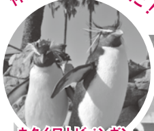
キタイワトビペンギン