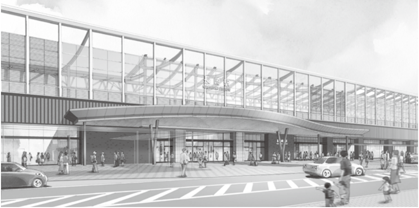
西口駅前広場イメージ図 (イメージは変更になる場合があります。)