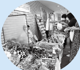
はあと屋による販売

「復職明けには、まずは明るく挨拶を行う」など、復職時の人間関係の不安を解消するコツを、キャリアコンサルタントの講師から学びました。