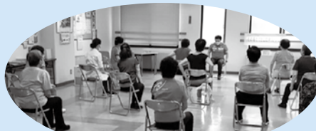
その場でできる簡単ストレッチ

参加者からは、「家族みんなで分担して家事を行うことの大切さを学ぶために、整理収納アドバイザーの講師から、片づけのコツなどを教わりました。」