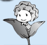
アマランスイメージキャラクター アマラちゃん