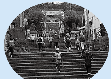
ノルディックウォーキング

10月4日(日)の「アマランスフェスタ」では、「長崎市男女共同参画推進センター アマランス」にて、長崎の女性団体やボランティアが企画した、男女共同参画に関する様々な講座や展示が行われました。 ①・②と、2日間にわたり、多くの方楽しんで学習していただくことができました。