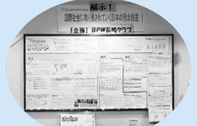
展示「国際社会に取り残されていく日本の男女格差—GGGIは121位」

長崎の女性団体による講座「宗教による性暴力・人権侵害を考える学習会」、DV加害者更生プログラムを体験する「DVをやめたい男性が変わるためのプログラム体験入門」も開催されました。