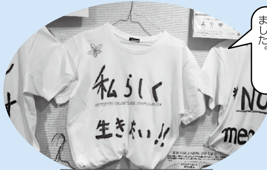
展示「私の気持ちをTシャツに」

長崎の女性団体による講座「宗教による性暴力・人権侵害を考える学習会」、DV加害者更生プログラムを体験する「DVをやめたい男性が変わるためのプログラム体験入門」も開催されました。