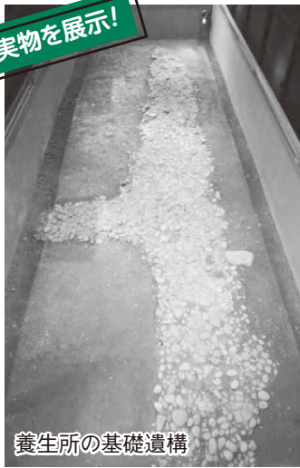
養生所の基礎遺構