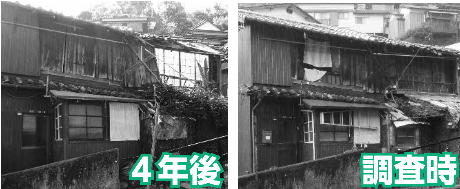
この時点で対象となります