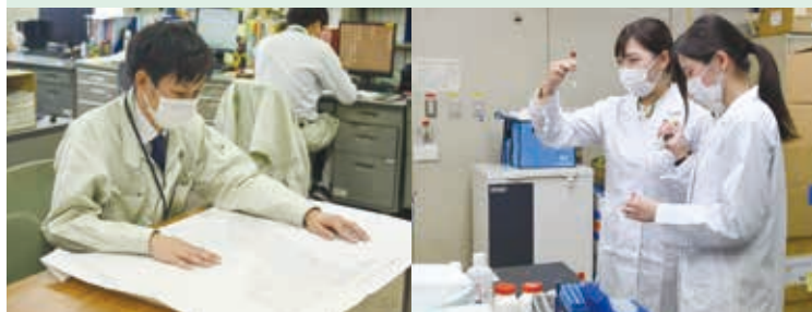
〈 告 告 〉