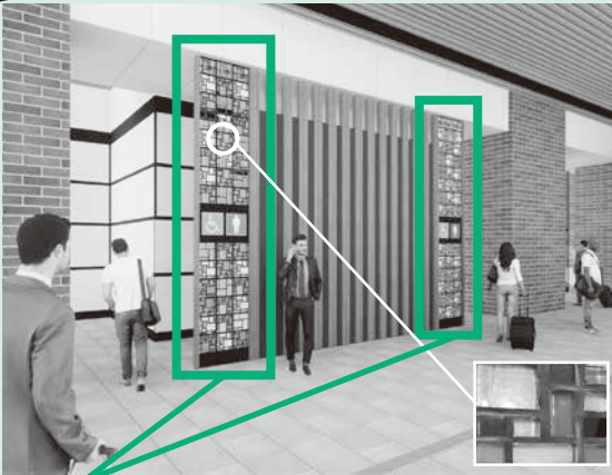
完成イメージ デザインは変更になる可能性があります

新幹線駅舎内のガラススクリーンに設置するガラスユニットを一緒に作ってみませんか？