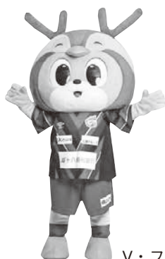
V・ファーレン長崎 クラブマスコット ヴィヴィくん