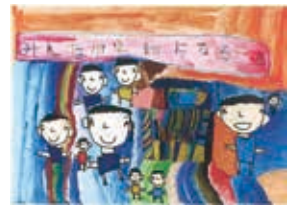
昨年入賞した作品