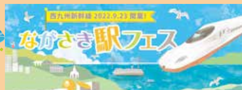
アートボードの下絵

新幹線の開業を楽しみにしている市内の中学生が、思いを込めたメッセージを書いたアート。アートはながさき駅フェス会場(4ページ)に展示されます！