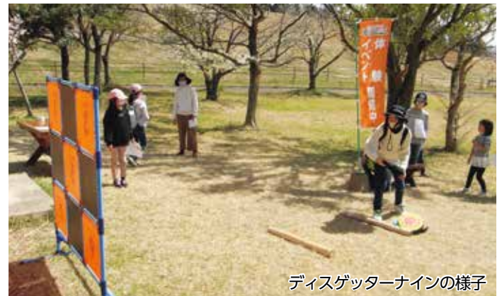
ディスクゲッターナインの様子

バグー、ラダーゲッター、ディスクゲッターナインなど楽しいレクリエーションが大集合!