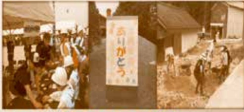
しゃきょう災害ボランティア（災ボラ）