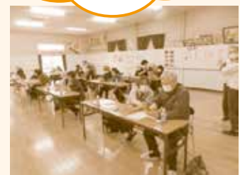
スマートフォン講座の様子

スマートフォンを手にしたばかりの方もたくさん参加されています。なごやかな雰囲気の中でお勉強できるので、一緒にステップアップしていきましょう！