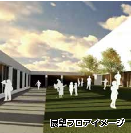
展望フロアイメージ

19階は「展望フロア」。まちなかの風景を一望でき、長崎港や女神大橋まで見渡せます。稲佐山などからの眺めとは違った風景を楽しめます。