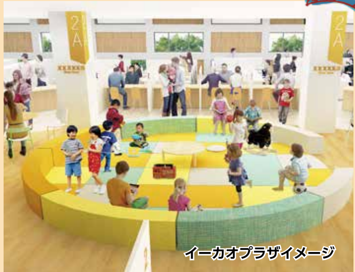
イーカオプラザイメージ