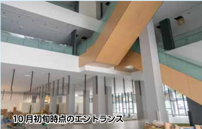
10月初旬時点のエントランス

1階は「総合窓口」。転入や婚姻・出生などのライフイベントの手続き、保険や年金などの手続き、高齢者、障害者、被爆者などの相談がワンフロアで行えます。手続きや相談などを安心して行えるようにプライバシーに配慮した窓口や相談室になっています。