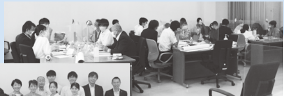
▲学生との意見交換の様子

8月22日「次世代を担う若者との意見交換について」サステナプラザながさきで活動するecoNながさきからお招きした大学生・高校生10名と、市内の大学生・高校生を対象に行った意識調査の結果を基に、「イベント」「教育」「日常の生活」の3つの班に分かれて意見交換し、各班から政策提案の発表などを行いました。