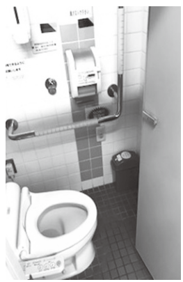
▲もりまちハートセンターの設置状況

健康寿命の延伸や高齢化に伴い、設置の必要性は高まっていくと考えており、この取組が公共施設や民間施設へも広がっていくよう、普及啓発に努めていきたい。