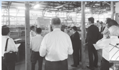
◀陸上養殖の現地調査

低コスト耐候性ハウスでは、JA長崎せいひ・担い手支援センターやハウスの経営者から、施設の概要や導入効果などについてご説明いただきました。