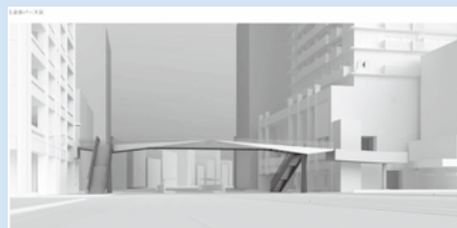
▲新大工歩道橋のイメージパース

委員会では、今回見直しを行った工期スケジュールの妥当性、歩道橋の完成時期が遅れることに関する施設利用者等への周知方法について質すなど、内容検討の結果、異議なく原案を可決しました。