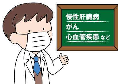
基礎疾患を有するかた