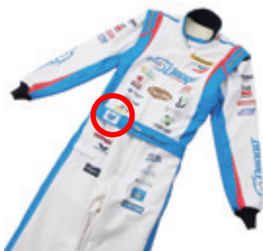
レーシングドライバーユニホーム