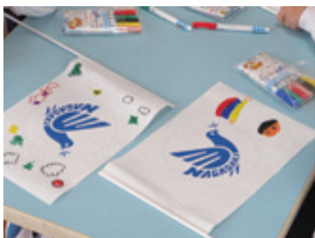
幼稚園で作成した手旗