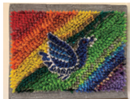
「長崎市障害者アート作品展」 出展作品