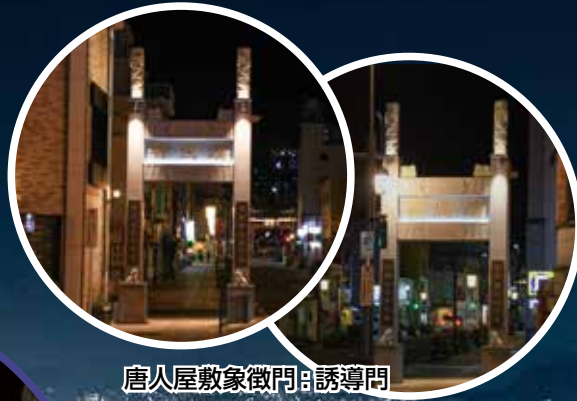
唐人屋敷象徴門：誘導門