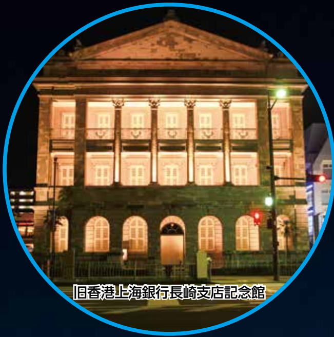
旧香港上海銀行長崎支店記念館