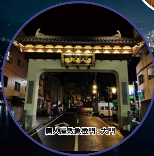
唐人屋敷象徴門：大門