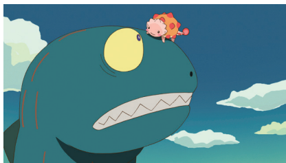
「おまえうまそうだな」©宮西達也／ポプラ社・おまえうまそうだな製作委員会