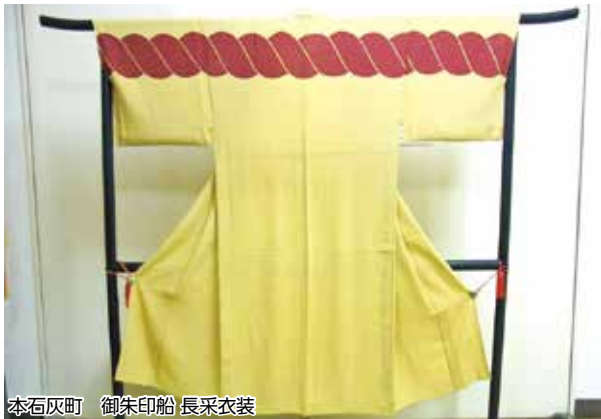
本石灰町 御朱印船 長采衣装