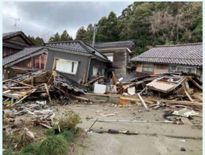
▲地震の影響で倒壊した家屋