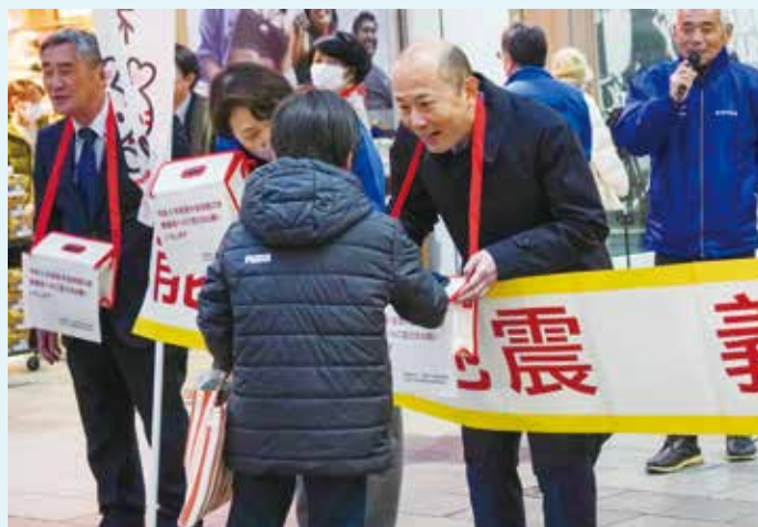
▲街頭で募金を呼び掛ける市長

また、市役所に12月まで設置している募金箱に3月末までに寄せられた896万298円や市職員・議会からの見舞金を送りました。