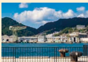
タイトル:みなとの守り人